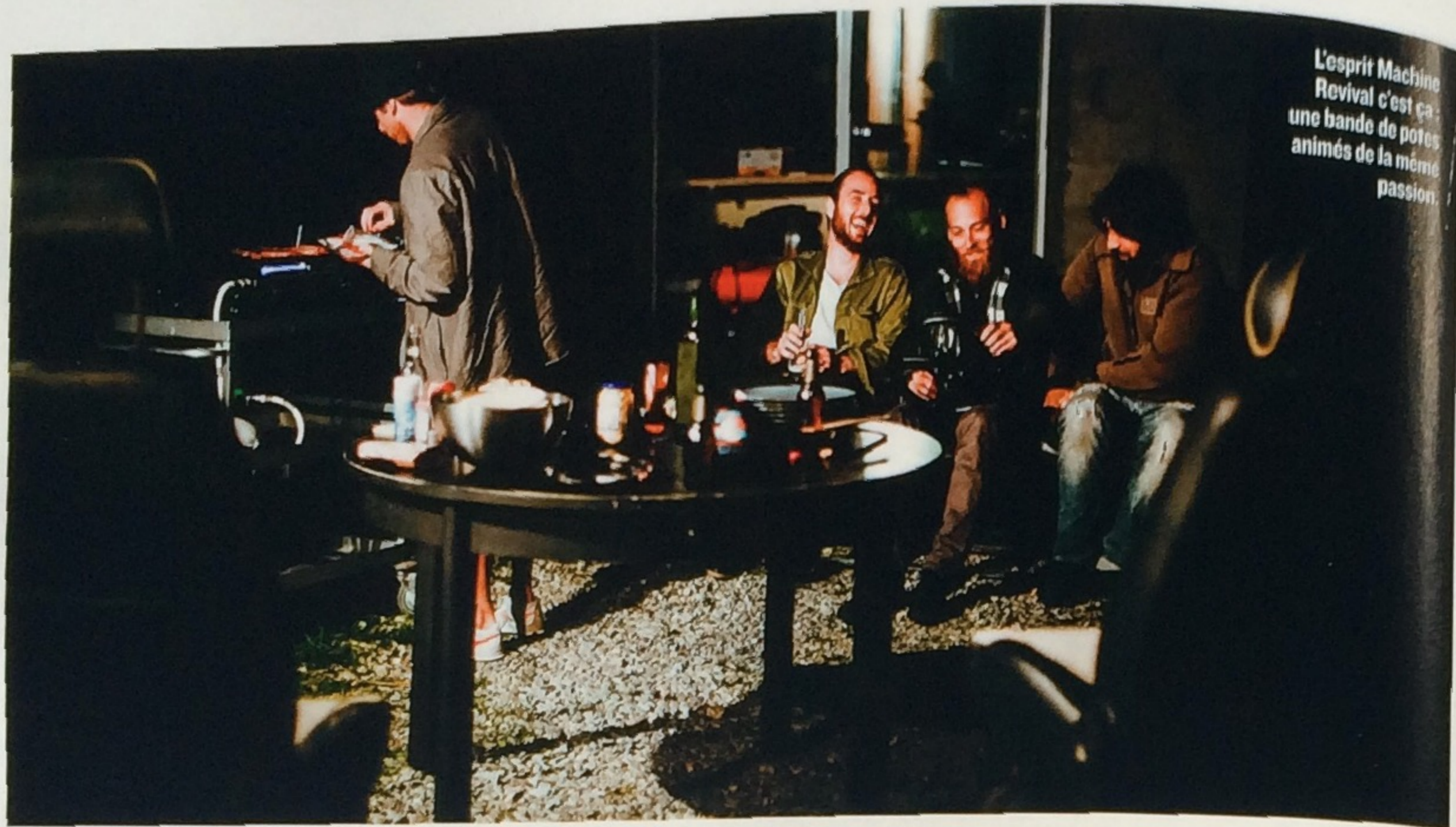
L'esprit Machine Revival c'est ça : une bande de potes animés de la même passion.