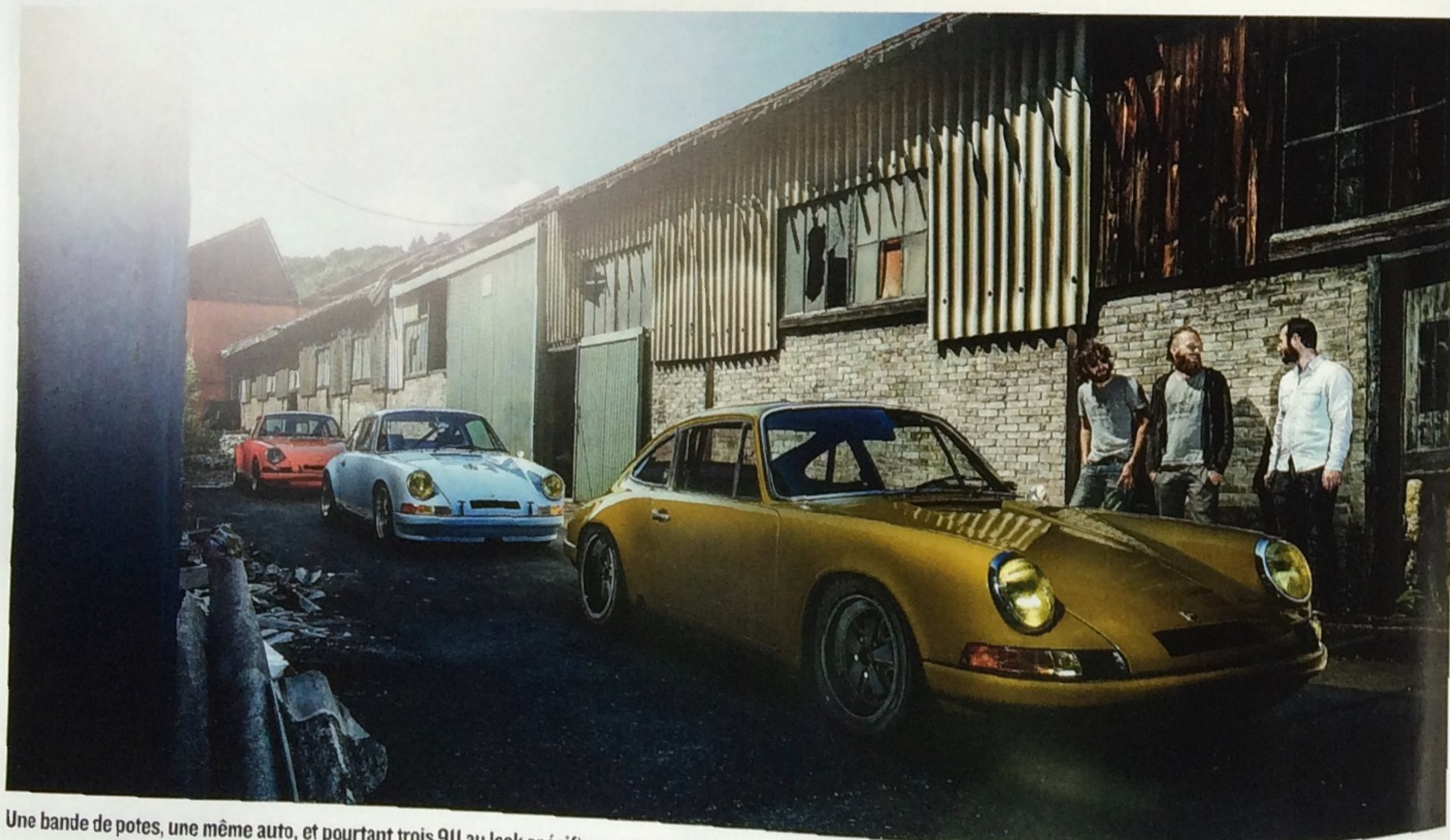
Une bande de potes, une même auto, et pourtant trois 911 au look spécifique qui servent de banc d'essai permanent pour de nouvelles pièces.